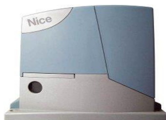
Рис. 3. Привод