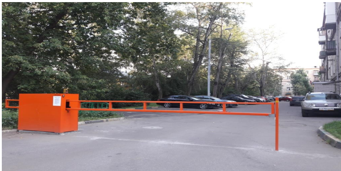
Рис. 2. Внешний вид шлагбаума

2.2.1. Размеры шлагбаума: Тумба шлагбаума в комплекте с направляющими роликами: размер 1100x400x1000, защита листом 2 мм, имеет окно для обслуживания привода с запирающим на встроенный замок. стандартный цвет - оранжевый, приемная стойка: труба 80 x 40 x 3, укомплектована уловителем для стрелы, стрела для проездов до 4 000 мм: горизонтальные связи – 40 x 40 x 2, вертикальные – 40 x 40 x 1.5, окраска, стандартный цвет - оранжевый, оцинкованная зубчатая рейка (пр-во Италия) в комплекте.